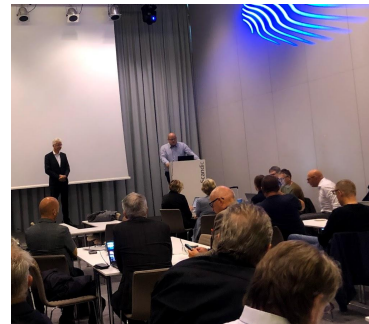
Felles regionrådsmøte Hardanger, Sogn og Voss 05.10.2021 i Bergen KS møte i Bergen 06.10.2021