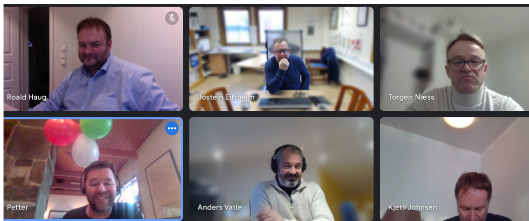
Digitalt Hardangerrådsmøte 17.12.2021